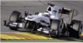
Brütsch/Rüegger Tools Promotional Partner of Sauber F1 Team