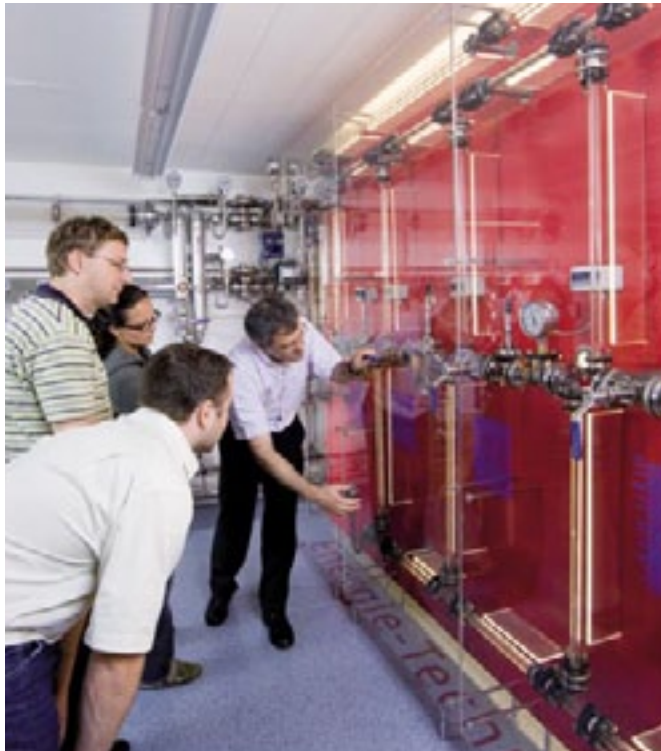
Das gläserne Rohrleitungssystem: Teilnehmende erhalten Einsicht in das Innenleben eines Systems

Professional Collection 2010 Formenbau und Stanztechnik Kennziffer 08.02