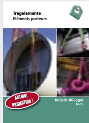
Tragelemente Lasten sicher heben, drehen und wenden! Kennziffer 05.02