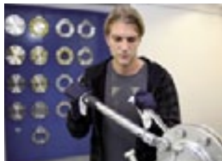
Künstlich erzeugte Verkantungen belegen den negativen Einfluss auf die Dichtheit

Die Franz Gysi AG demonstriert beispielhaft, wie ein technischer Handelsbetrieb mit anspruchsvollen Produkten die Zukunft angehen kann. Ein starkes Team von Ingenieuren und Konstrukteuren entwickeln zusammen mit den Kunden massgeschneiderte und wirtschaftliche Lösungen. In allen Kompetenzbereichen kommt der Schulung grosse Wichtigkeit zu. Dazu hat die Franz Gysi AG ganze Schulungslabors eingerichtet. In einem für den Laien verwirrenden «Röhrenwirrwarr» werden Prozesse – und Fehlprozesse – sichtbar gemacht. Zum Beispiel die Belastung eines geschlossenen Dampferzeugungs-systems durch nicht abgeführtes Kondensat. Durch Glasrohre und «aufgeschnittene» Ventile und Verbindungsstücke werden Phänomene visualisiert und wirkungsvoll mit Praxisnähe vermittelt.