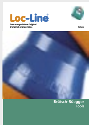
Loc-Line Das orange-blaue Original Kennziffer 04.02