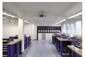
Das Montage-Institut ist eingerichtet: Gesamtaufnahme des Schulungsraums in Suhr