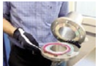
In die Dichtungen eingelegtes Fuji-Papier sagt viel über die Qualität der Verschraubung aus

Auf www.fgysi.ch können Sie sich mehr Informationen über das Aargauer Unternehmen beschaffen. Die aktuellen Schulungstermine finden Sie gleich auf der Eingangsseite. Übrigens: der erste Kurs «Flanschmontagen» ist bereits ausgebucht! Für einen Überblick über alle Kompetenzbereiche der Franz Gysi AG in Papierform fordern Sie unter Kennziffer 71.02 die Firmendokumentation (d, f) an!