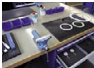
Der Blick auf einen Ausbildungsplatz – natürlich mit Werkzeugen von Brütsch/Rüegger Tools